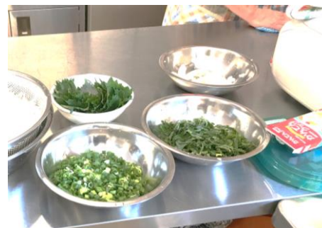
ねぎ、大葉も準備しました