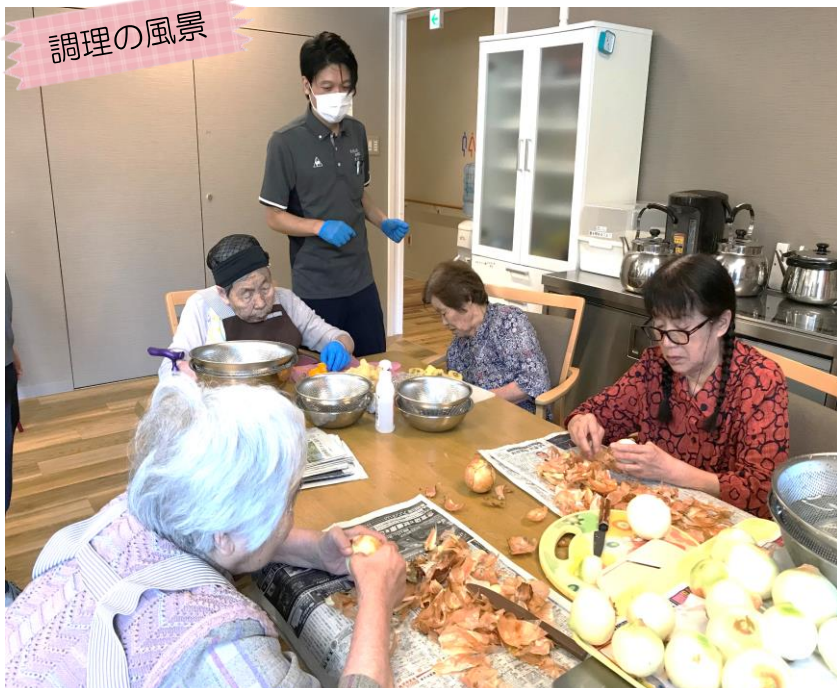
真剣に調理しています