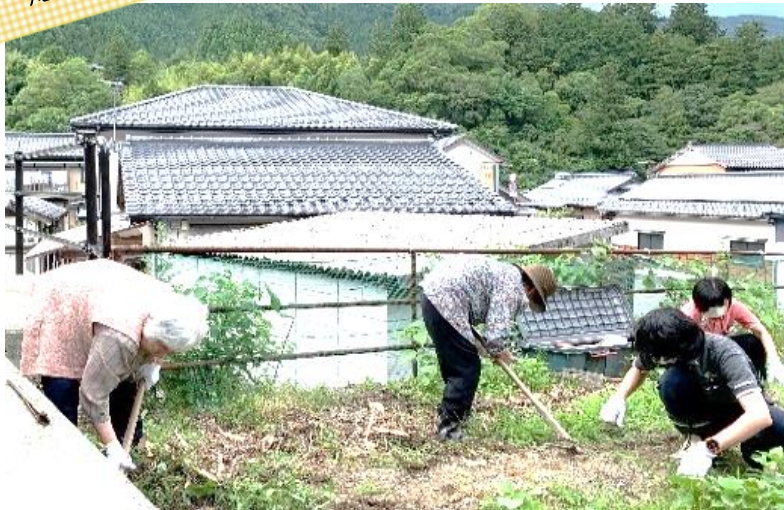
玉ねぎの手入れを定期的に行っています