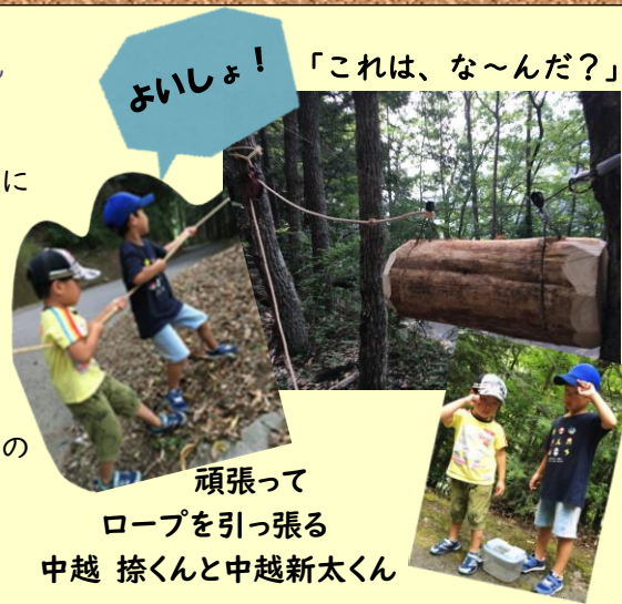
頑張って ロープを引っ張る 中越 捺くんと中越新太くん

発行元: 社会福祉法人 梶原町社会福祉協議会 住所: 高知県高岡郡梶原町川西路 2321-1