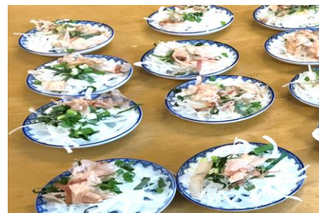
玉ねぎサラダの出来上がり〜♪