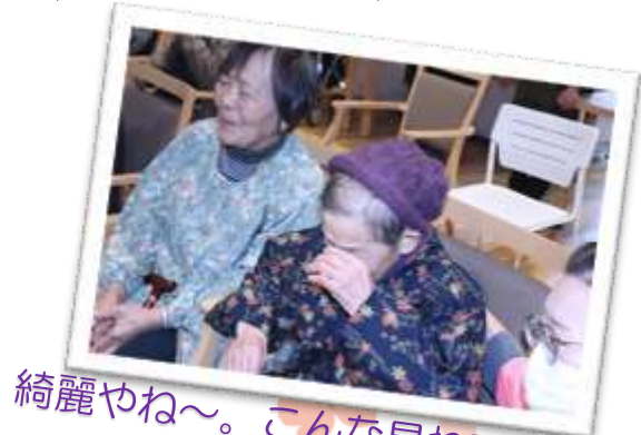
綺麗やね〜。こんな見れて幸せ と涙