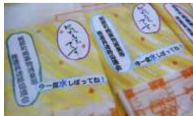
▲産業祭のクイズの景品