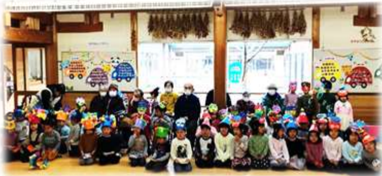
みんなでぎやかに♪