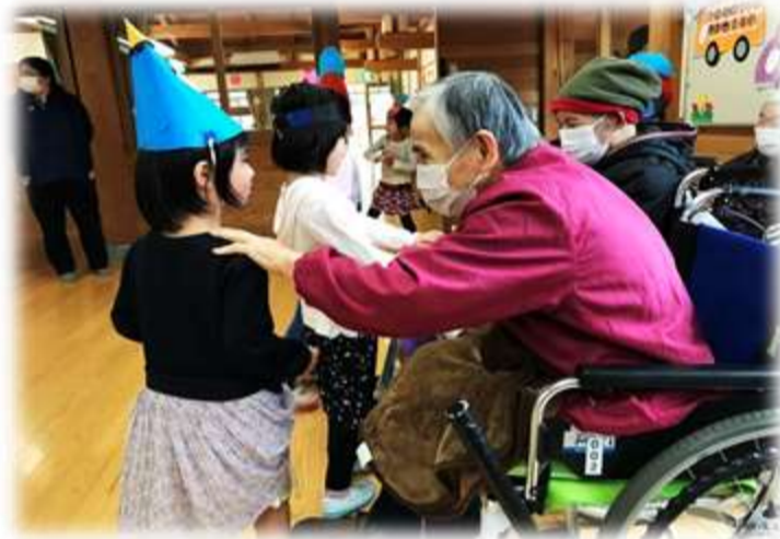
また、ゆるりに遊びに来てよ~

子ども達の純粋な優しさや、可愛い笑顔につられて、利用者さんもケアハウス内とはまた違った自然な笑顔になります。今後も、地域とのかかわりが持てる機会を増やしていきたいと思います。