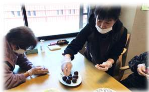
夢中であんこを丸めてます