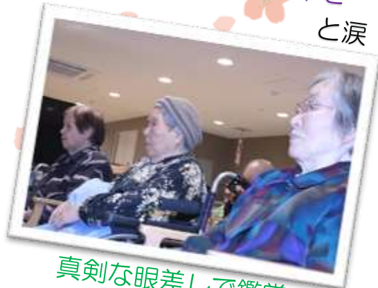
真剣な眼差しで鑑賞