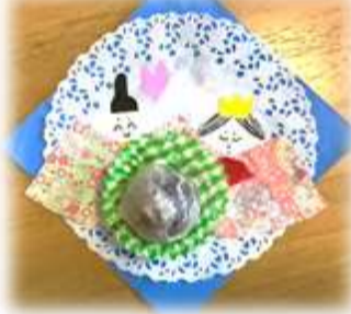
手づくりのおひなさまで華やかに