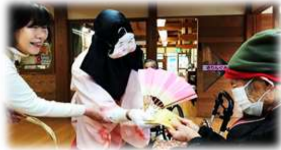
福の神からプレゼントも