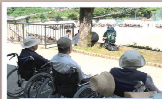
梶原学園運動会に応援へ

ケアハウスゆるりでも9月11日に2階(ケアハウス)と3階(生活支援ハウス)と合同で敬老会を開催しました。こども園の園児達が遊びに来て歌や踊りを披露してくれたり、職員による出し物など、皆でとても楽しい時間を過ごしました★ 記念品贈呈では、入居者様が素敵な笑顔を見せてくれたり涙ぐまれる方もいらっしやって職員一同“やって良かった”と思ったことでした。