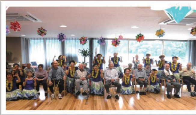
雲の上NANI(美しい)ゆすはらの皆さん