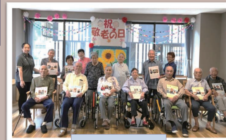
敬老会の集合写真!