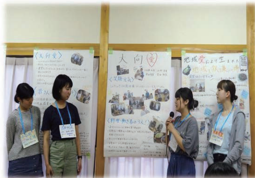
◀ 活動成果発表の様子