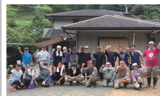
20人がかりで約2tの土砂撤去が終了。ご依頼者「やっと一段落ついた！」(7/28)

災害VCの運営には外部支援者も勿論必要ですが、地理や人の顔がわかる、地域の方々の支援が最も頼りになります*1。「できる人ができる時にできること」で、支援の輪が広がります。今度も災害VCへの理解を深めていただけるよう運営模擬訓練等を企画して参りますので、その際には多くの皆様のご参加をお願いいたします。 *1 2011年西南豪雨災害は、地区長や地域の方が運営に加わり、災害VC運営、特にボランティア派遣がスムーズに行え、多くのボランティアが活動した。